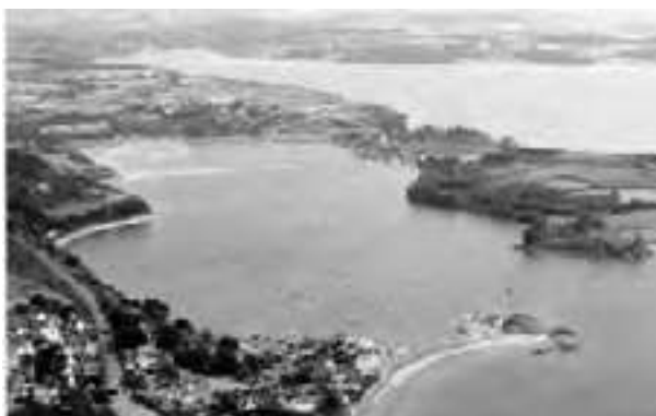
Vues aériennes de la zone de mouillage et d'hivernage gérée par l'A.P.P